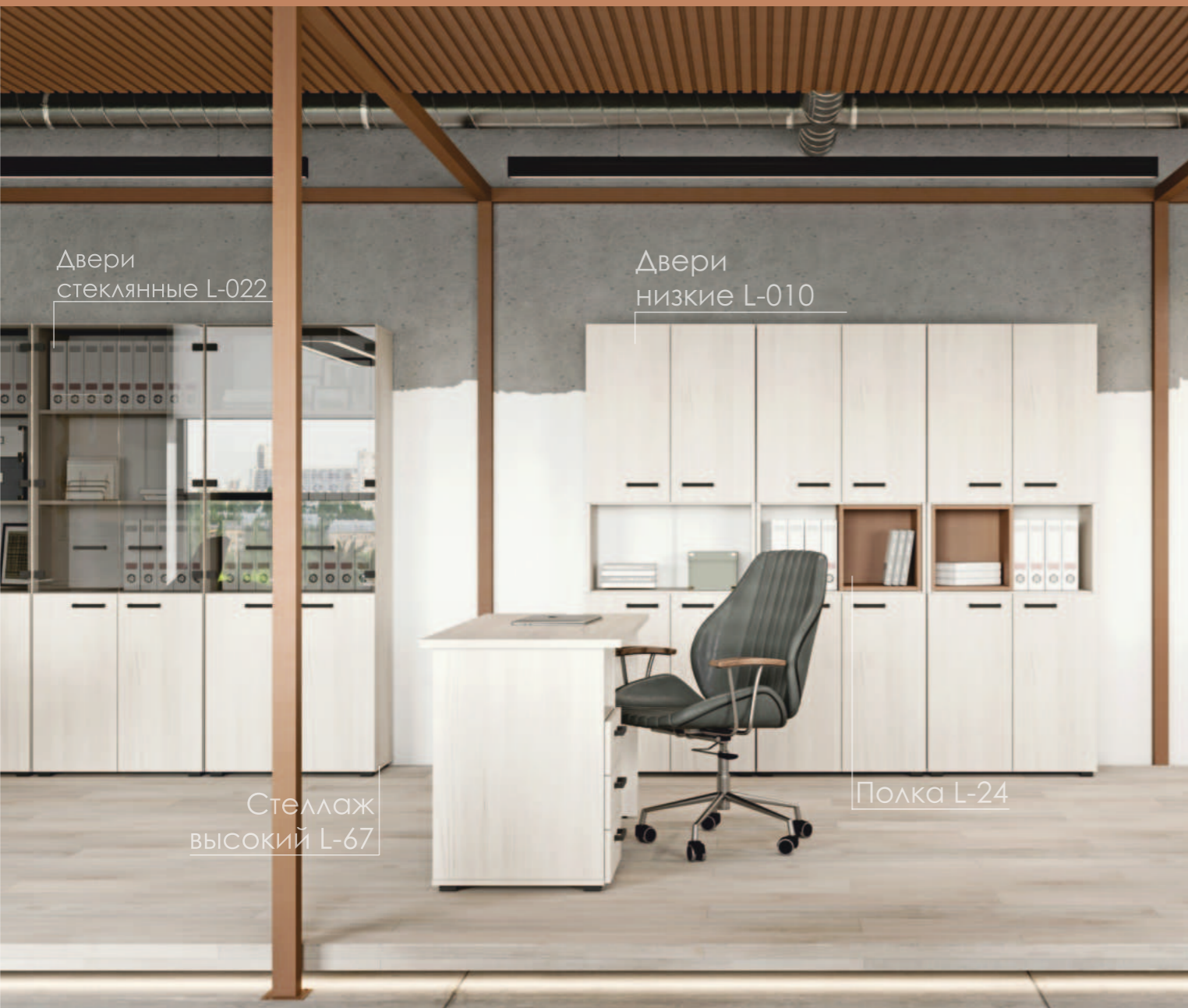
Двери стеклянные L-022