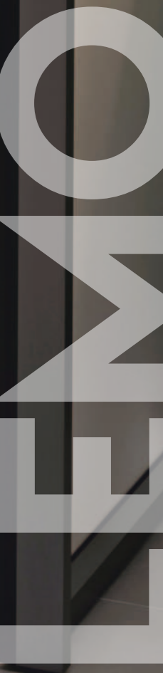
Двери высокие L-030