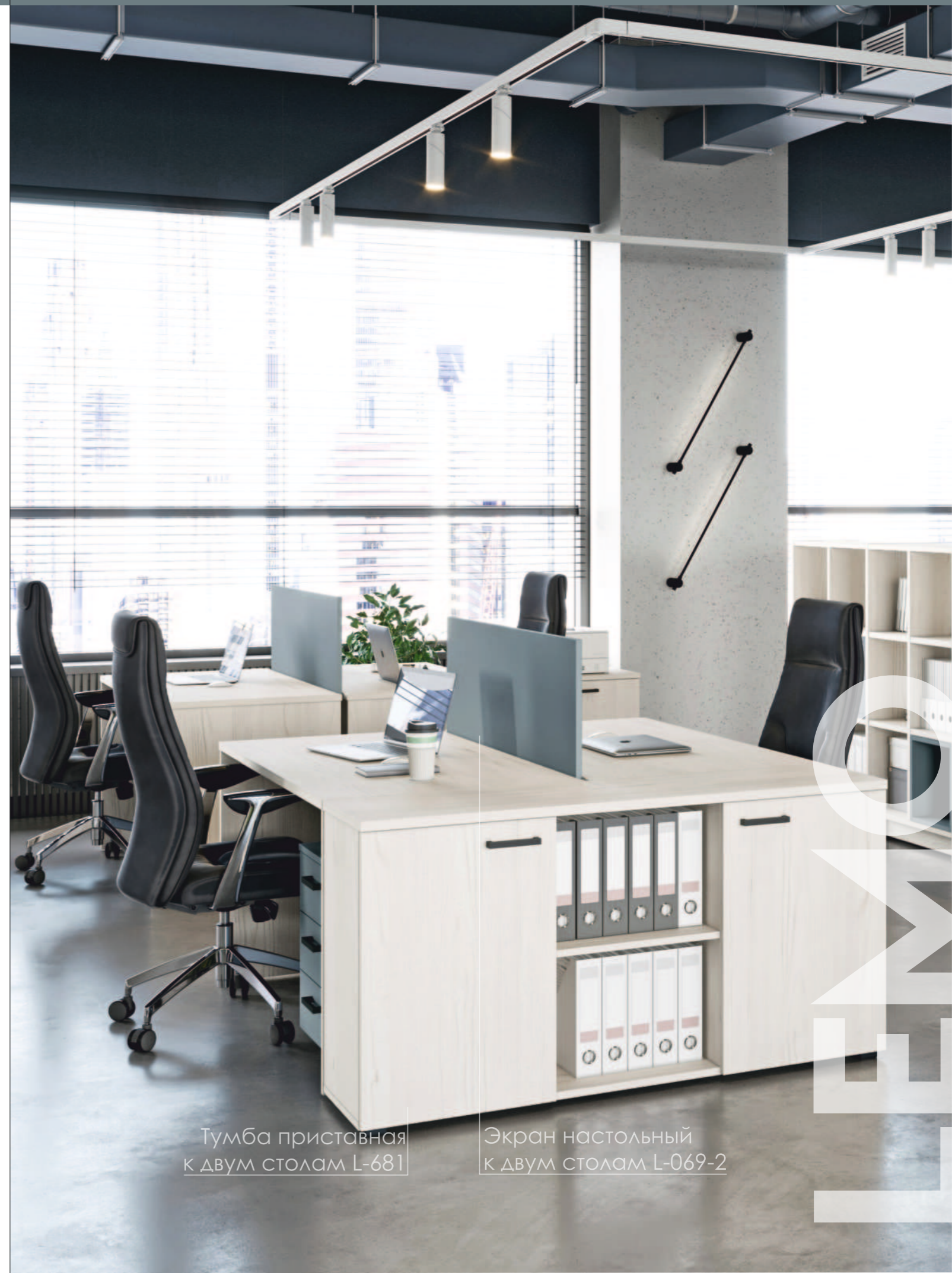
Тумба приставная к двум столам L-681