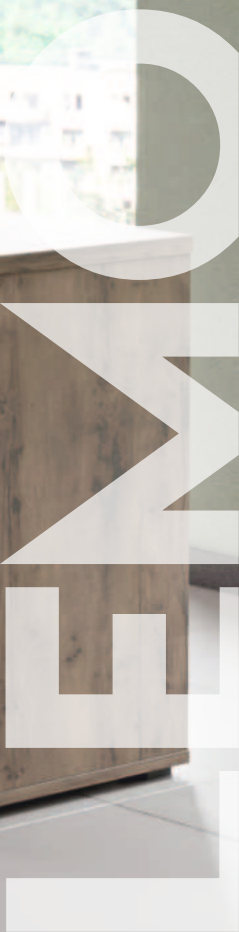
Тумба приставная L-233