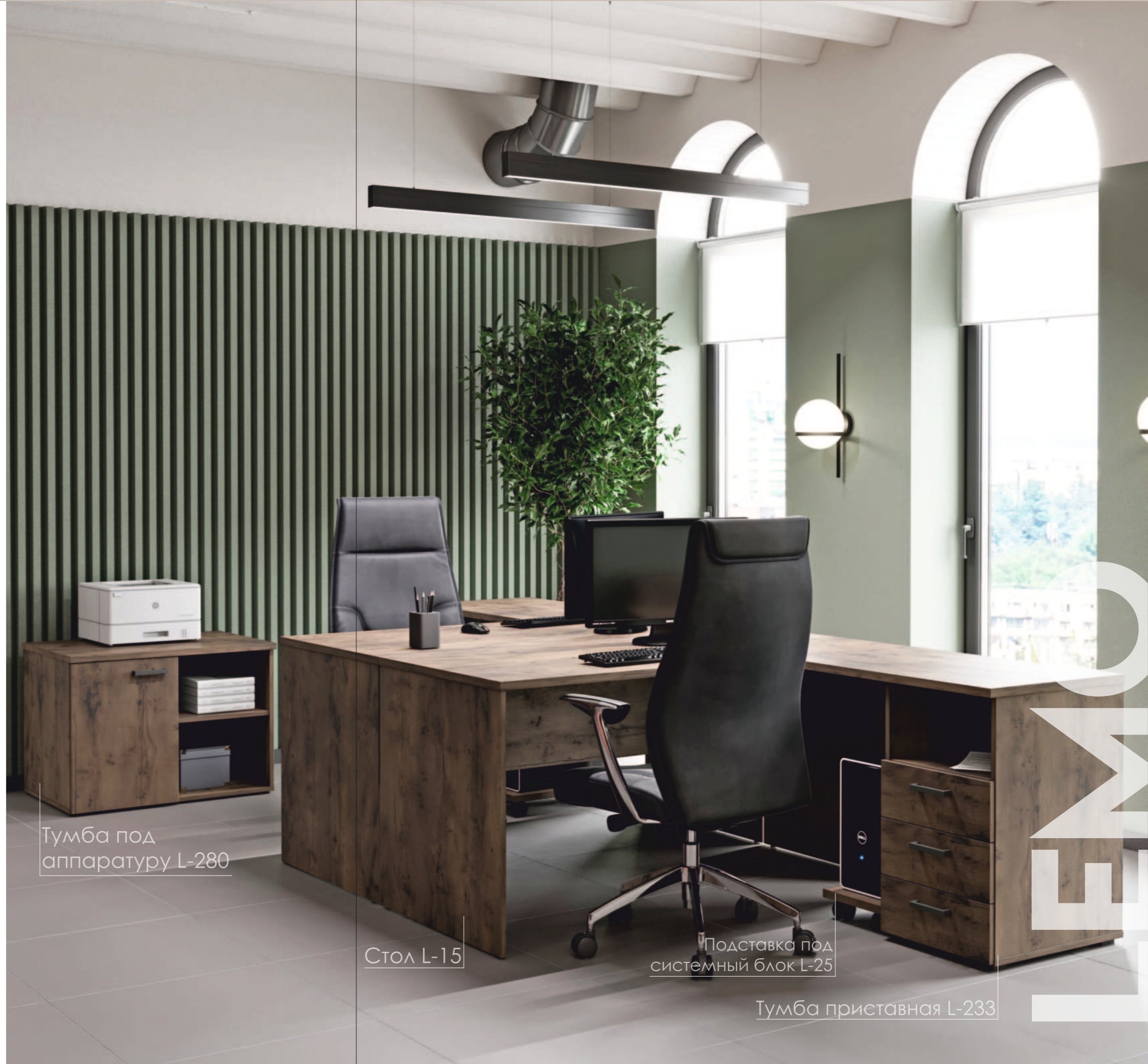
Тумба под аппаратуру L-280