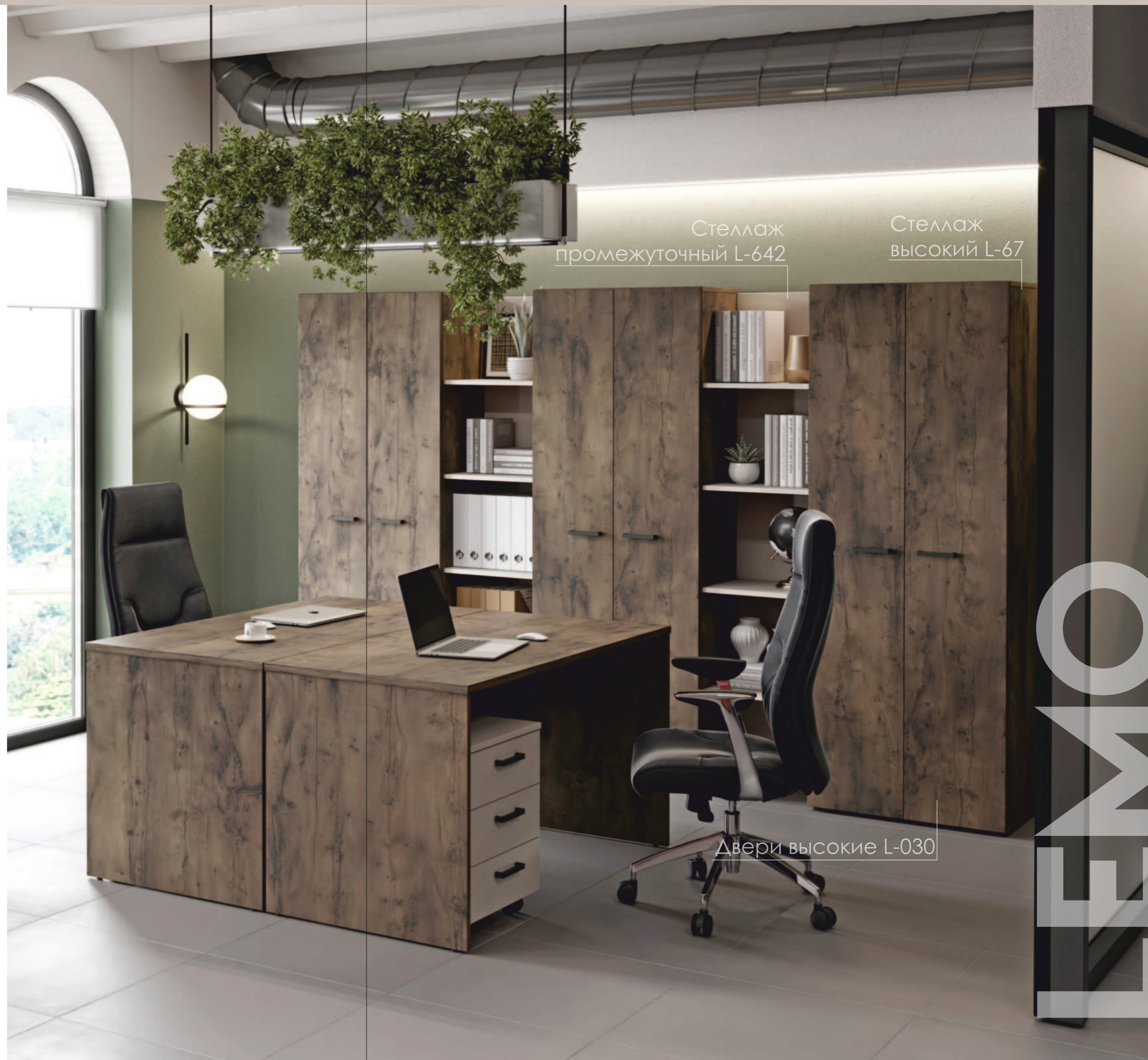
Стеллаж промежуточный L-642

Наслаждайтесь стройной композицией элементов и несравненным качеством мебели от фабрики «Экспро».