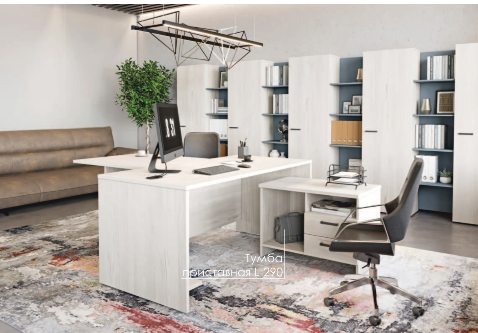
Тумба приставная L-290